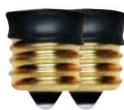
Adaptateur de métal