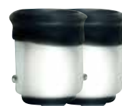
Adaptateur de cuivre