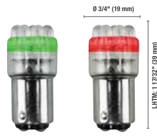
S6 - 7 Groupe - Baïonnette D.C.