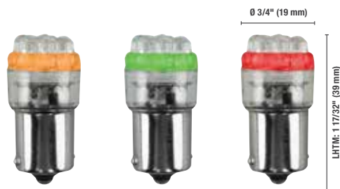
S6 - 7 Groupe - Baïonnette S.C.