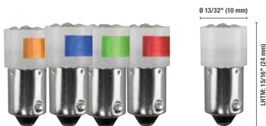
T-3 1/4 - 7 Groupe