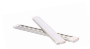
ArmoniaMD Barres DEL 24 V