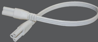
Câbles de raccordement (12", 48", 72", 96")